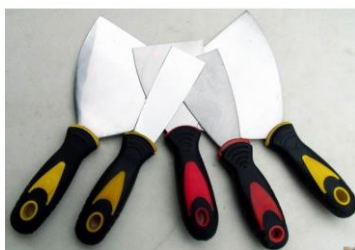
úzká stěrka / špachtle