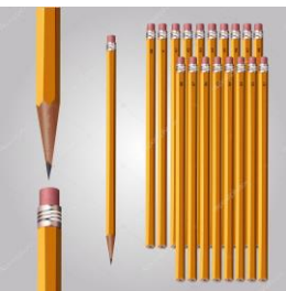
obyčejné tužky č.2, HB