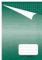
sešit čtverečkovaný A4