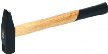
kladivo (250-300 g)