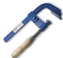
2 ks ztužidlo 300 mm