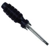
šroubovák s vyměnitelnými bity (nástavci- Pz1,Pz2,imbus4)